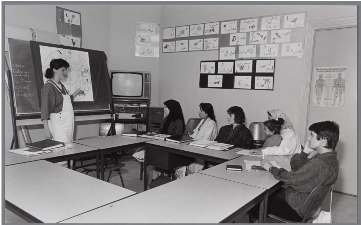
Kadertraining gezondheid voor Turkse en Marokkaanse vrouwen, 1987

Hoe ZMV-vrouwen via informatieverstrekking abortus en geboorteregeling bespreekbaar maakten.