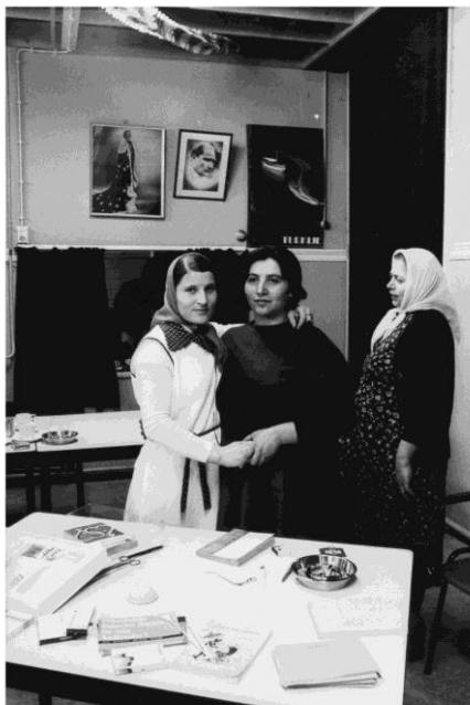
Voorlichting over anticonceptie aan Turkse vrouwen, 1979