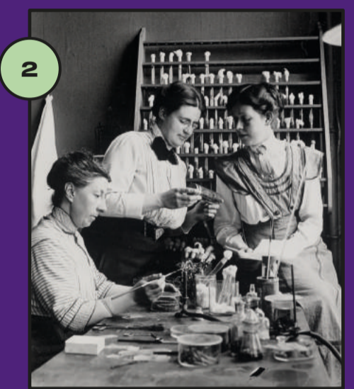
Johanna Westerdijk met studenten in het laboratorium waar zij directeur was (1910). Er werkten veel vrouwen in haar laboratorium, in die tijd heel bijzonder.