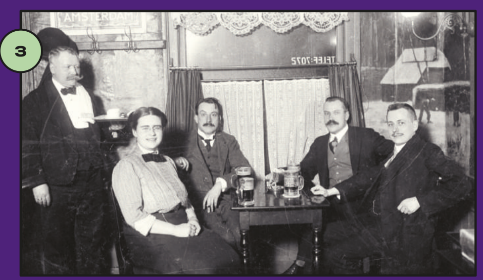
Als enige vrouw drinkt Johanna Westerdijk hier een biertje in café Eik en Linde (1912). Ze brengt haar geveugelde uitspraak 'Werken en feesten vormt schoone geesten' in de praktijk.