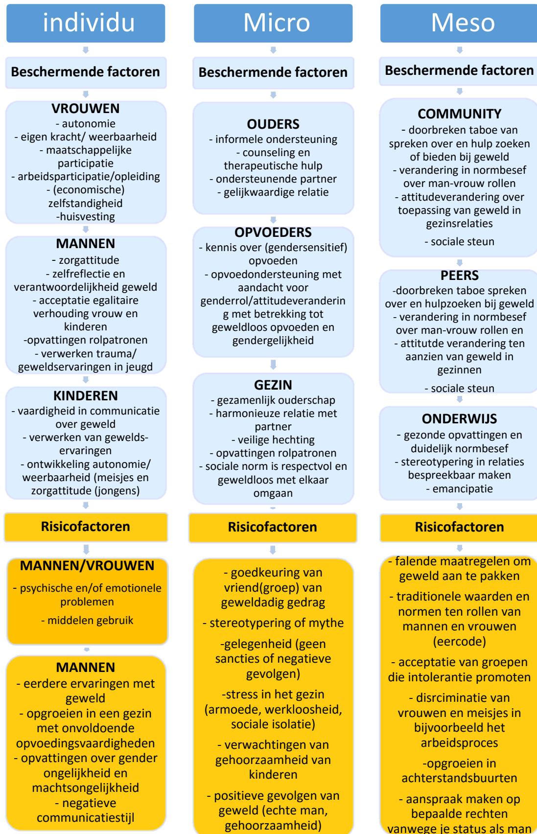
Schema 2: Beschermende factoren en risico factoren ten aanzien van het voorkomen en doorbreken van huiselijk geweld vanuit het perspectief van gezinnen. 4