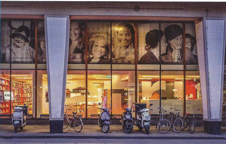
Atria in 2015 op de Vijzelstraat 20 in Amsterdam.

>> bevorderen, we wilden ook erkenning van ons werk van het openbaar archiefwezen. We wilden dat zij wisten dat wij het goed deden. We wilden niet beschuldigd worden dat we het 'respect des fonds', het herkomstbeginsel, niet hanteerden en respecteerden.